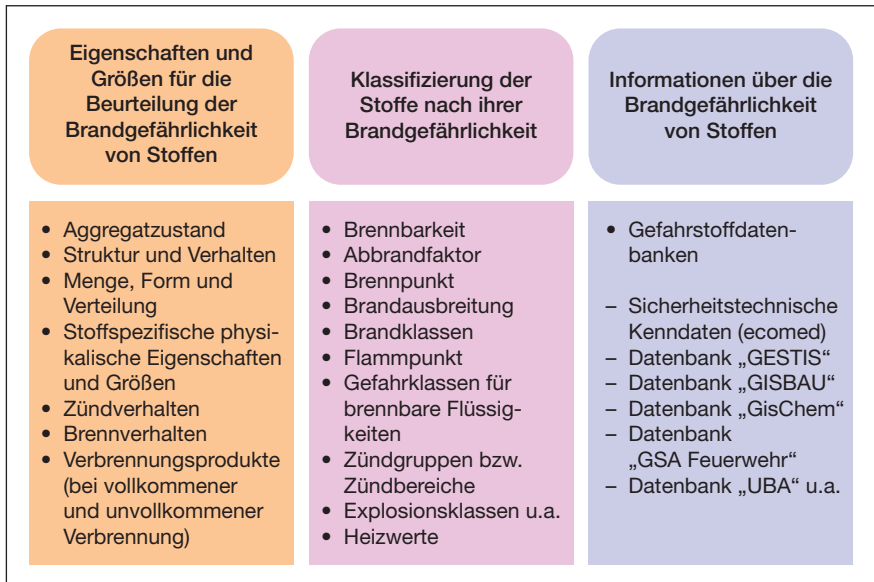
Abb. 19: Brandgefährdung von Stoffen

Hinsichtlich der brennbaren Stoffe ist noch einmal zu betonen, dass bei der Untersuchung die Eigenschaften, Menge und räumliche Anordnung miteinander eingeschätzt werden müssen.