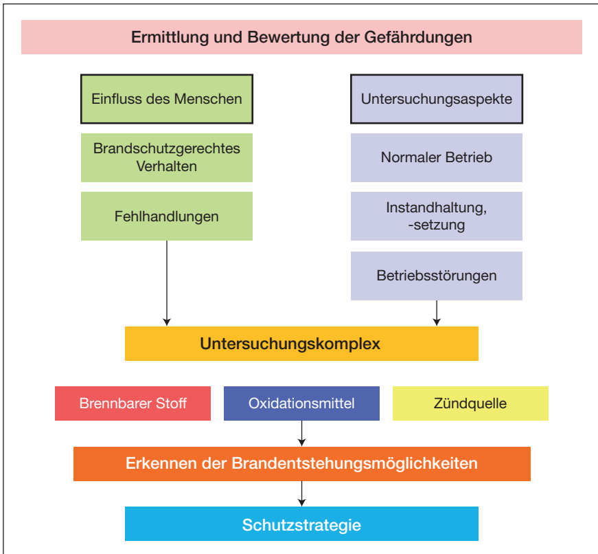
Abb. 17: Erkennen der Brandentstehungsmöglichkeiten

Jeder Brand ist eine unkontrolliert ablaufende Verbrennung, die nur entstehen kann, wenn bestimmte Voraussetzungen dafür vorliegen. Die Voraussetzungen für das Entstehen und Ablaufen einer Verbrennung sind: brennbarer Stoff , Sauerstoff und eine für den jeweiligen Stoff bestimmte Zündtemperatur .