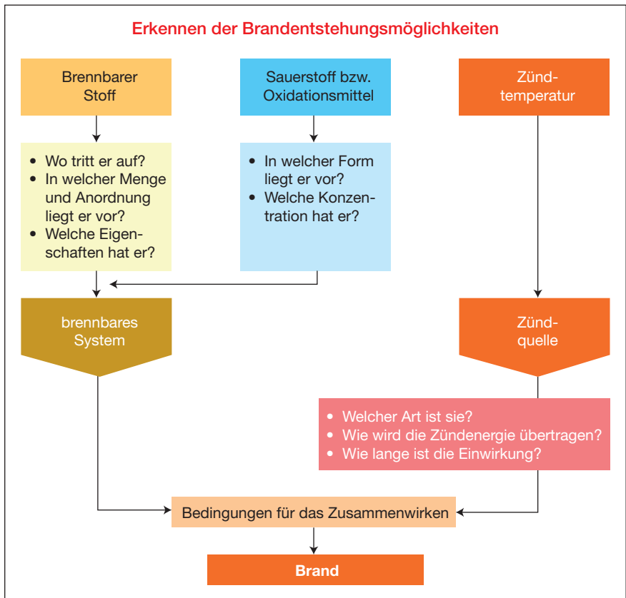
Abb. 18: Untersuchungskriterien

Wichtig sind die Kenndaten, die die Möglichkeit der Bildung zündwilliger Gas- bzw. Dampf-Luft-Gemische und das Zündverhalten der brennbaren Stoffe charakterisieren (Abbildung 19).