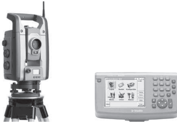
Abb. 6.2: VX Spatial Station (Trimble)

Die Verwendung von Bildinformationen bei der Tachymetrie erfolgt durch die Überlagerung eines Objektbilds mit den Planungs- oder Messdaten. Die Anzeige im Display (Abb. 6.3) dient zur Orientierung, Überprüfung der Vollständigkeit, Punktzuordnung und Kontrolle der Lagegenauigkeit (WASMEIER 2009).